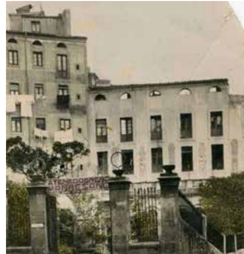
Ateneu de les Piques

Oci i diversió. La societat manresana de les primeres dècades del segle XX era molt diferent de la societat tradicional. L'arribada de nombrosos immigrants, les noves activitats laborals i les diferències econòmiques i socials dels grups socials d'aquells